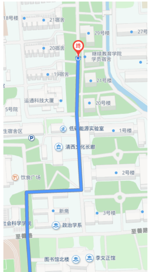
学员宿舍楼周边放大图