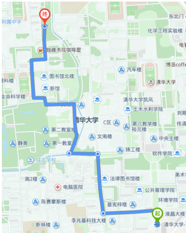
自清华大学东南门到学员宿舍楼的全线图